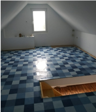
ausgebauter Spitzboden Teil 1