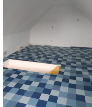
ausgebauter Spitzboden Teil 2